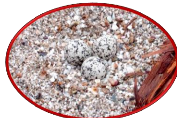
▲シロチドリの巣と卵