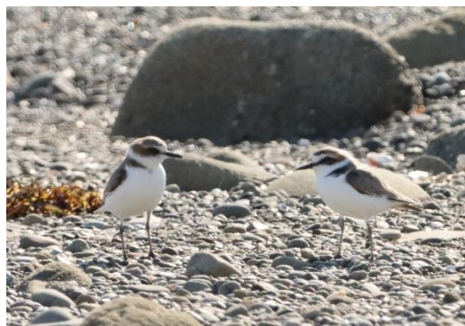
▲シロチドリ 淡路島にて

チドリの仲間であるシロチドリは、日本でも繁殖をするチドリとして、過去には全国各地の砂浜にたくさん生息していました。しかし近年、開発等による砂浜環境の減少等によって、大幅に数を減らしています。シロチドリは2012年の環境省レッドリストで「絶滅の危機が増大」しているとして絶滅危惧Ⅱ類に指定されています。