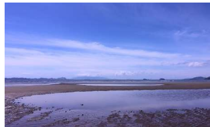
▲大きな潮だまりができた干潟

ひょうごけん し しんまいこはま かんちょうじ すなはま しお 兵庫県たつの市の新舞子浜では、干潮時には砂浜に潮だまりが しゅつげん うみ い もの かんさつ 出現し、海の生き物を観察することができます。どんな生き もの ひがた す く らしているのか調べてみました。 なつやす じゅうげんきゅう い ものかんさつ さんこう ※夏休みの自由研究（生き物観察）の参考にしてみてください。