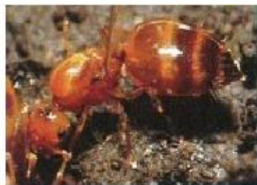
キイロシリアゲアリ(女王)