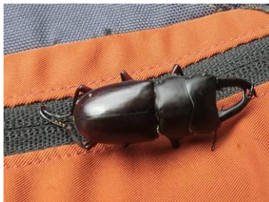
クワガタムシの角