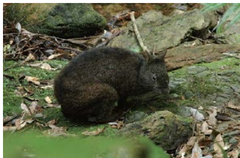
アマミノクロウサギ