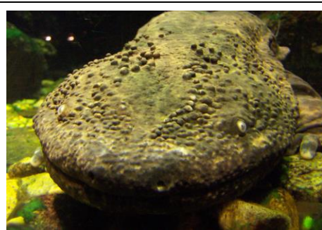
オオサンショウウオ