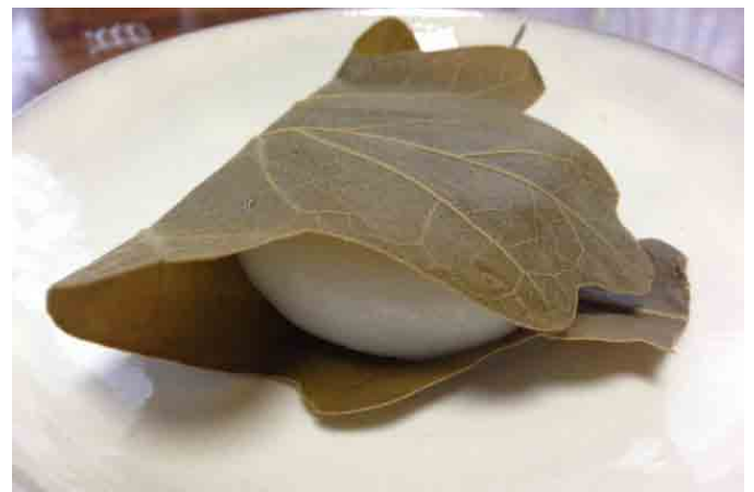
【カシワの葉で包まれた柏餅】

サトイモ科の多年草。ユーラシア大陸に広く分布し、池や川などの水辺に生育します。薬草としても用いられます。