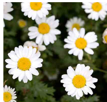
ひょうごけん はな 【兵庫県の花：ノジギク】